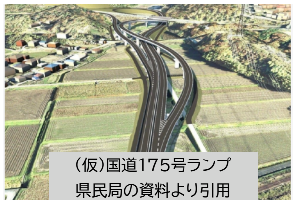
(仮)国道175号ランプ 県民局の資料より引用